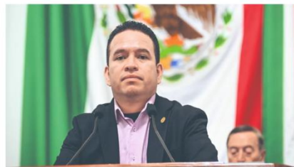
Diputado de Morena, exigió al Gobierno y las alcaldías abatir los maltratos contra los ancianos

Luego de que se han reportado algunos abusos contra los adultos mayores en la Ciudad de México, el Congreso capitalino aprobó realizar un exhorto a la Secretaría de Inclusión y Bienestar Social, el Consejo Ciudadano para la Seguridad y Justicia, así como las alcaldías para realizar mayores acciones que garanticen el cuidado de este sector.