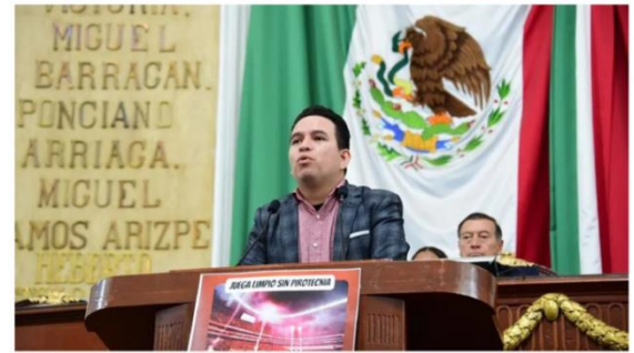
El diputado Christian Moctezuma presentó una iniciativa que plantea evitar el uso de pirotecnia en los eventos públicos masivos

La iniciativa fue presentada en el Congreso local y busca beneficiar tanto a personas como a otros seres vivos, indicó Christian Moctezuma, diputado de Morena.