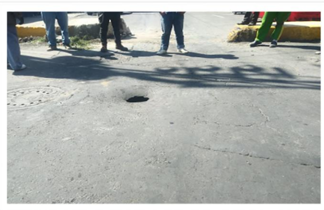
Aparición de socavones sobre la calle 20 de noviembre.