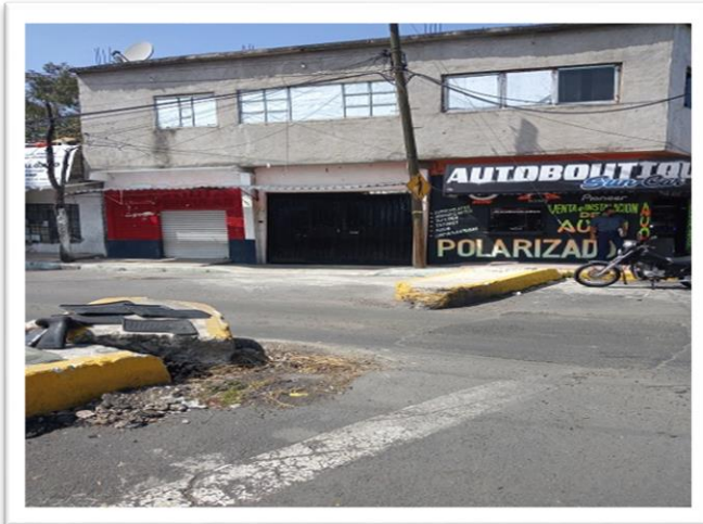
Calle 20 de noviembre, esquina con Avenida Reforma Agraria

Asimismo, se requiere de un estudio por parte de la Secretaría de Gestión Integral de Riesgos y Protección Civil de la Ciudad de México. Así como del sistema de Aguas de la Ciudad de México, para que determinen las condiciones en las que se encuentra el suelo de la calle 20 de noviembre, y se generen las condiciones de seguridad correspondientes a fin de garantizar la seguridad de las y los vecinos de la zona.