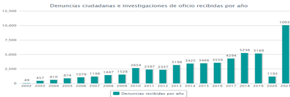
Fuente: Sistema de Atención de denuncias y Actuaciones de Oficio de PAOT, disponible en http://www.paot.org.mx/contenidos_graficas/delegaciones/graficas_gral.php

Por lo que hace a nuestra Ciudad de México, según cifras de la Procuraduría Ambiental y del Ordenamiento Territorial de la Ciudad de México, las denuncias ciudadanas e investigaciones de oficio, se han incrementado considerablemente del año 2002 al 31 de diciembre de 2021, recibiendo un total de 54,229 denuncias ciudadanas e investigaciones de oficio.