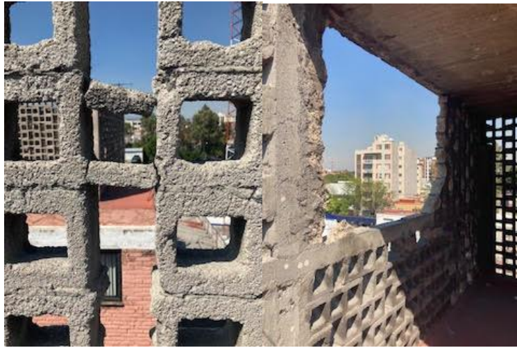
AZOTEA HIDALGO 39 EDIFICIO F