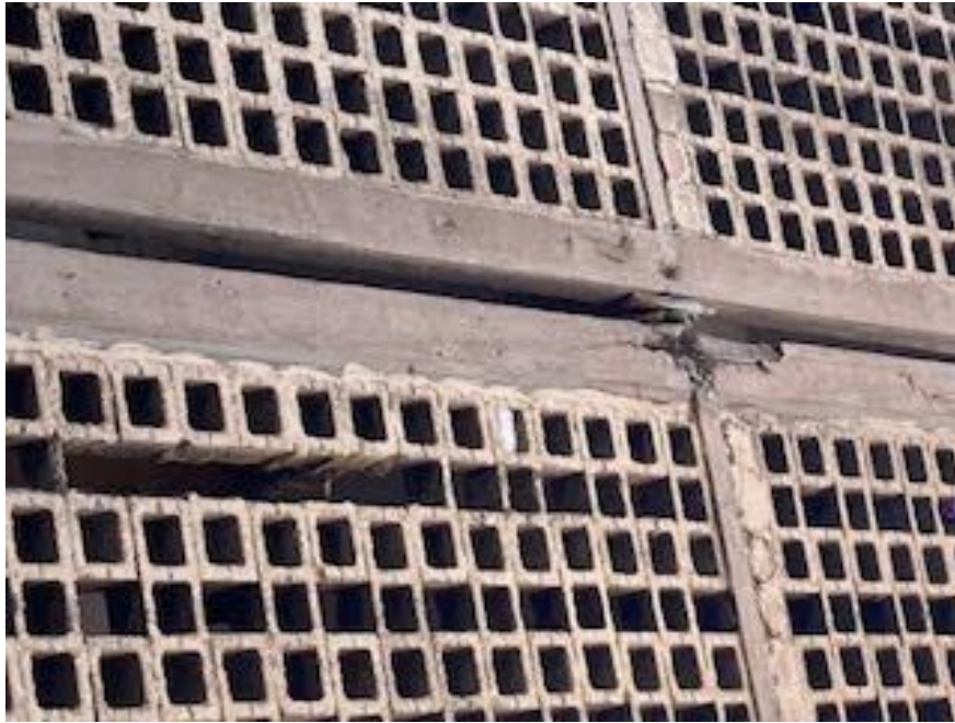
HIDALGO 39 EDIFICIO F