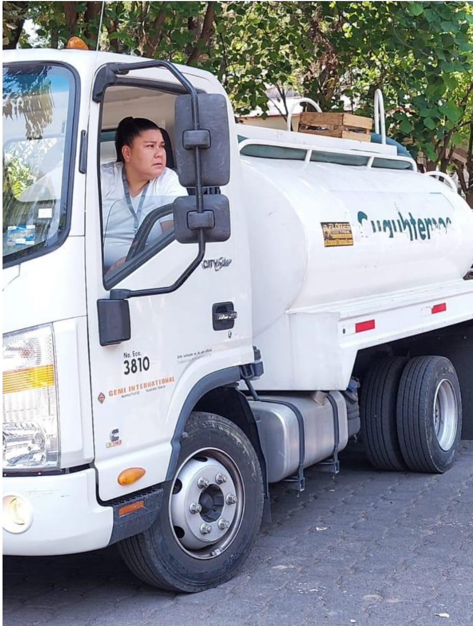
Imagen: Se aprecia a la C. manejando un vehículo de la alcaldía Cuauhtémoc en las inmediaciones de la Plaza Río de Janeiro, colonia Roma durante los enfrentamientos con las protestas feministas en contra de la violencia política.