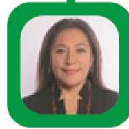
XOCHITL BRAVO ESPINOSA PRESIDENTA