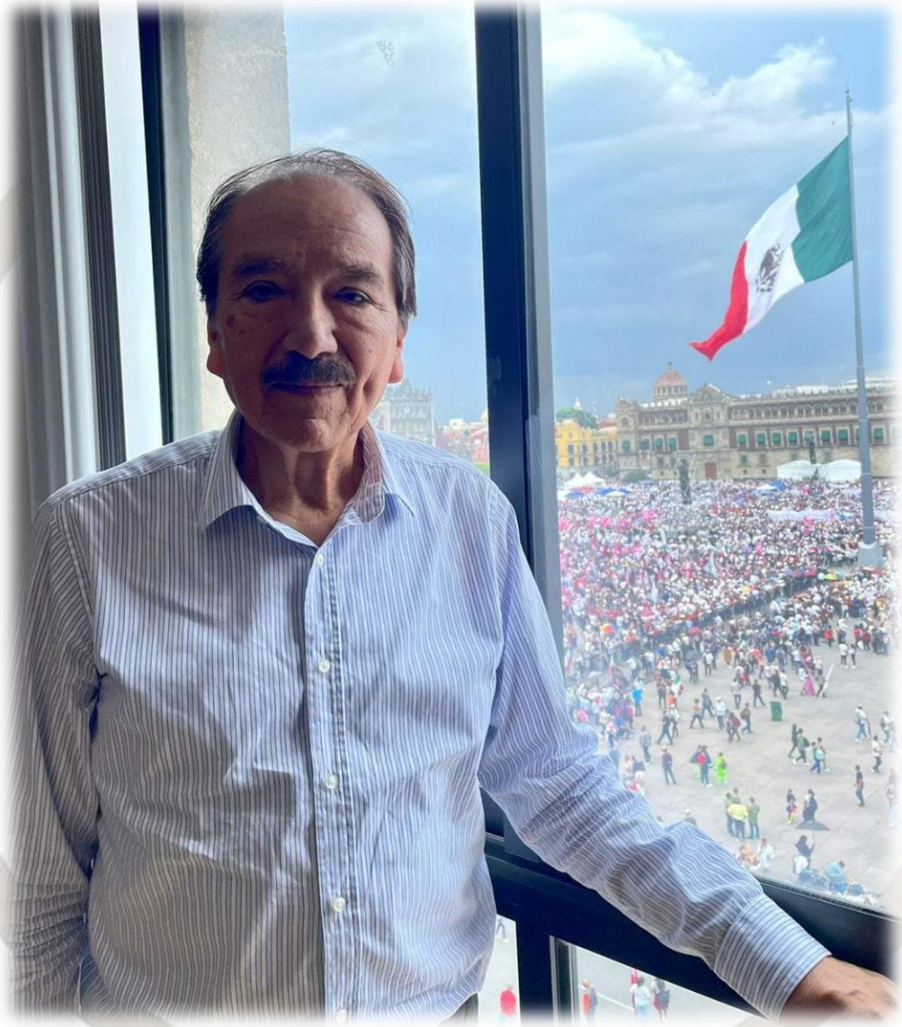
DIP. JOSÉ DE JESÚS MARTIN DEL CAMPO CASTAÑEDA