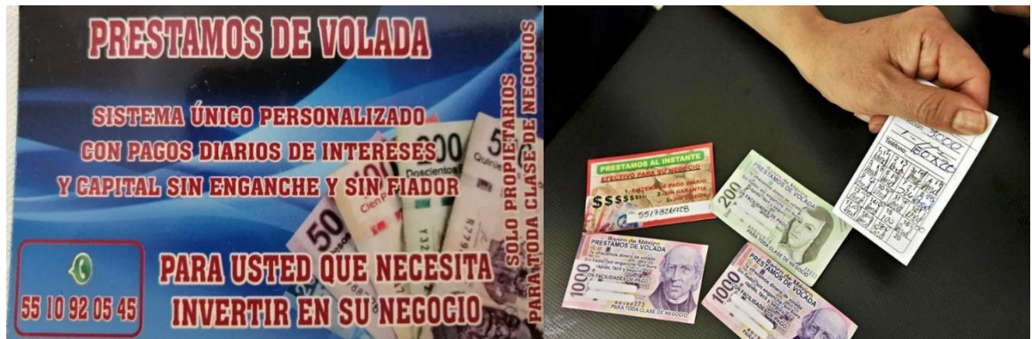
Imágenes de las tarjetas donde se ofrecen préstamos, para posteriormente después de, cobrar intereses muy por encima de lo otorgado.

Cabe decir que, según la ley, por un préstamo se debe cobrar alrededor del 6% anual, pues de otra manera se considera "usura" y esta práctica está penada por la ley.