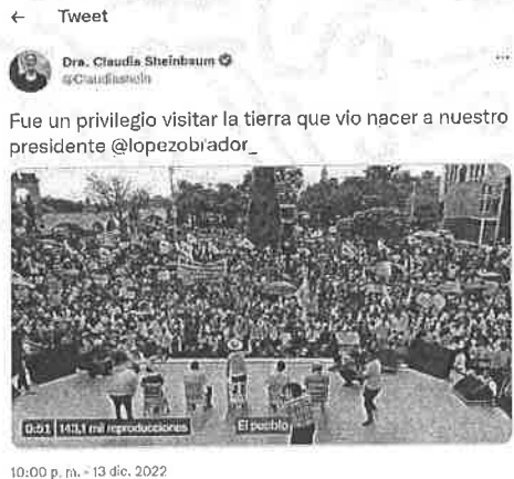
Visible en el link

https://twitter.com/Claudiashein/status/1601730232234696705?s=20&t=ZnTSbm5KIAxl9tldMCY HOW