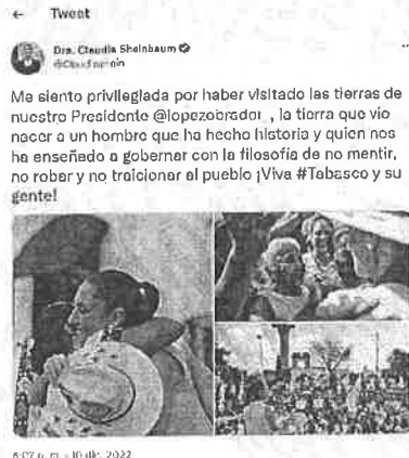
Visible en el vínculo electrónico

https://twitter.com/Claudiashein/status/1601730232234696705?s=20&t=ZnTSbm5KIAxl9tldMCY HOW