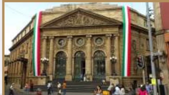
Sesionan en el Palacio de Donceles

Se integrará por 66 diputaciones, 33 electas según el principio de mayoría relativa, mediante el sistema de distritos electorales uninominales, y 33 según el principio de representación proporcional.