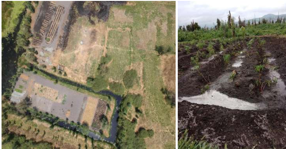
Fotografía 15 Salinidad del suelo chinampero por hundimientos diferenciales

47.- Lo que se busca con la declaratoria de patrimonio cultural material científico y tecnológico de interés para la ciudad de México, es la conservación y el impulso de las actividades agrícolas como parte de una política para el desarrollo de la zonas rurales y su reconocimiento como pates integrales, sustanciales y fundamentales para el goce de los derechos establecidos en la constitución política de la Ciudad de México.