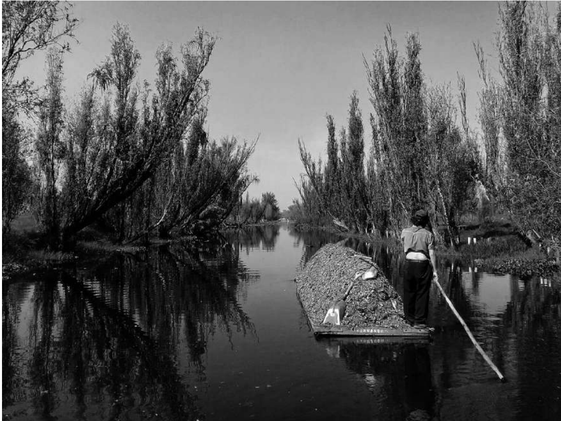
Fotografía 6 Chinampero transportando estiércol para fertilizar la chinampa

37.- El suelo de conservación de la Ciudad de México forma parte de la región central del altiplano mexicano, y es uno de los cuatro centros de origen diversidad genética del maíz, en donde se ha reportado que se cultivan 40 variedades de 6 razas de maíz, en casi 3 mil hectáreas. Más del 50 por ciento de la Ciudad de México está catalogado como suelo de Conservación, importante barrera al crecimiento urbano que aporta bienes y servicios ambientales indispensables para el equilibrio ambiental de la zona metropolitana y el campo.