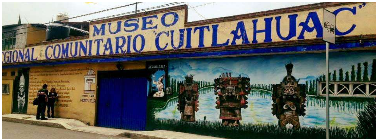
Fotografía 18 Fachada del Museo Regional Comunitario Cuitláhuac

DICTAMEN QUE PRESENTA LA COMISIÓN DE DERECHOS CULTURALES DEL CONGRESO DE LA CIUDAD DE MÉXICO, RELATIVO A DIVERSOS PUNTOS DE ACUERDO POR LOS QUE SE EXHORTA RESPETUOSAMENTE A LA SECRETARÍA DE CULTURA DE LA CIUDAD DE MÉXICO, PARA QUE A TRAVÉS DE LA COMISIÓN INTERINSTITUCIONAL DEL PATRIMONIO CULTURAL, NATURAL Y BIOCULTURAL DE LA CIUDAD DE MÉXICO, SE REALICE LA EVALUACIÓN CORRESPONDIENTE PARA DECLARAR DIVERSOS BIENES Y ELEMENTOS AFECTOS AL PATRIMONIO CULTURAL, NATURAL Y BIOCULTURAL DE LA CIUDAD DE MÉXICO