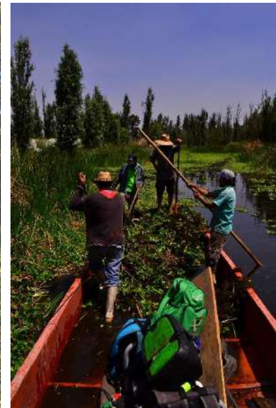
Fotografía 16 Cuadrilla de limpieza de canales

48.- Por lo anterior, se exhorta respetuosamente a la Secretaría de Cultura a través de la Comisión Interinstitucional del Patrimonio Cultural, Natural y Biocultural ambas de la Ciudad de México, a realizar la evaluación correspondiente para la Declaratoria de las Chinampas, como Patrimonio Científico y Tecnológico de interés para la Ciudad de México, y así promover el desarrollo de las actividades agrícolas y su preservación como parte integral para el desarrollo de la ciudad.