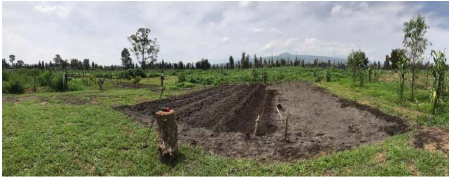
Fotografía 13 Parcela chinampera de Tláhuac

necesario. Estas características permitieron practicar una agricultura independiente del régimen de lluvias. La producción de la chinampa es permanente, dan de tres a cuatro cultivos dependiendo del producto. 28