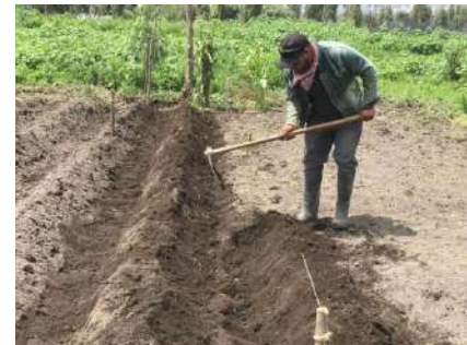
Fotografía 4 Técnicas tradicionales de agricultura chinampera: extracción de lodo, ensemillado de chapín y preparación de camas de cultivo en orden de enunciación

34.- La agricultura desarrollada en las chinampas como actividad fundamental de las tribus nahuatlacas que partieron de Aztlán, fue la base para la conformación de lo que en su momento fue parte del territorio del imperio Mexica, inclusive se han encontrado vestigios de chinampas en el Estado de México y Morelos.