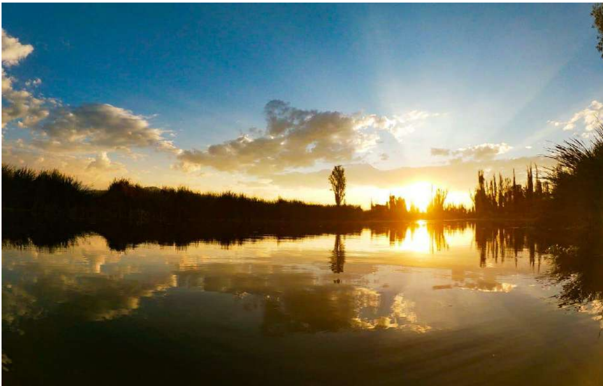
Fotografía 1 Atardecer Lacustre desde Tláhuac

26.- A poco más de 20 kilómetros, en línea recta del Zócalo de la capital mexicana, todavía se encuentran comunidades originarias que practican la agricultura peculiar de la Cuenca del Valle de México, un sistema de cultivo que se desarrolló en los tiempos de esplendor de esos antiguos lagos, mucho antes de la construcción de México-Tenochtitlan por los mexicas. Es la agricultura chinampera, que sobrevive en dos alcaldía del sur de la Ciudad de México en Xochimilco y Tláhuac. 20