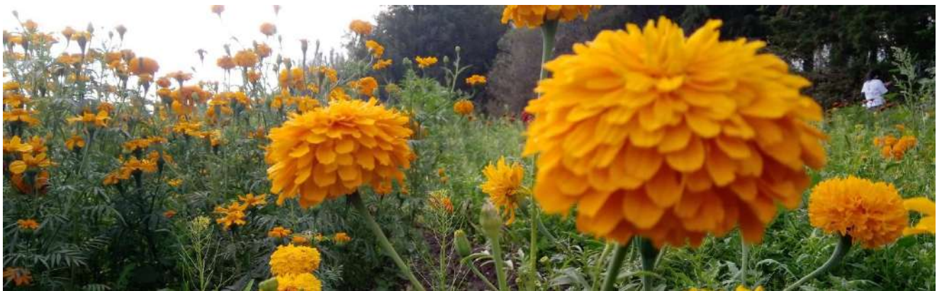
Fotografía 14 Siembra de Flor de Cempaxúchitl

45.- Con el crecimiento urbano que data de la época del Porfiriato hasta nuestros días, así como la desecación de los canales, la necesidad de vivienda por parte de la población, la creación de zonas y centros económicos, la expansión de las vías de comunicación, y el crecimiento natural de la población y su desdoblamiento sobre el territorio redujo considerablemente el área de extensión de la zona chinampera de la Ciudad de México. El cambio de uso de suelos de agrícola tradicional a pecuario, agroindustrial, habitacional irregular, y más recientemente al sector turismo, ha ocasionado un abandono de las prácticas agrícolas aunado al mal manejo de los recursos destinados al impulso y conservación del sector primario dentro de la zona lacustre de la Ciudad de México.