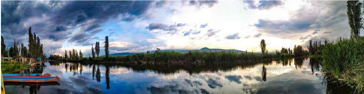
Fotografía 5 Embarcadero del Lago de los Reyes.