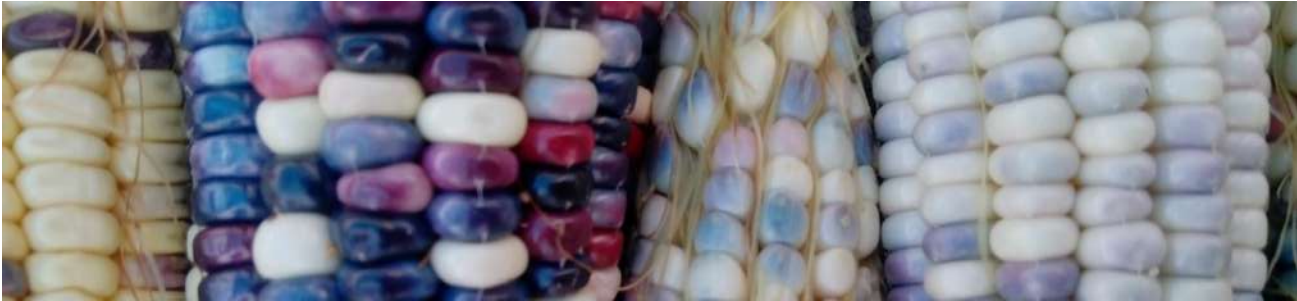
Fotografía 7 Cosecha de distintos tipos de maíz

39.- La Comisión Nacional para el conocimiento y uso de la Biodiversidad (Conabio) financió la recolección de maíz en el sur de la Ciudad de México, para el Banco de Germoplasma de Maíz del Instituto Nacional de Investigaciones Forestales Agrícolas y Pecuarias Inifap (Conabio, 2010). Con las recolectas realizadas, Serratos y col. (inédito) identificaron las razas chalqueño, cónico, cacahuacintle, cacahuacintle-palomo, ancho pozolero, palomero, arrocillo, elotes cónicos, elotes chalqueños y algunas variantes de pepitilla, junto con mezclas raciales y complejos. Estas mismas, salvo el ancho pozolero, se encuentran en la colecta de 2012 llevada a cabo por la Comisión de Recursos Naturales (Corena) y la Universidad Autónoma de la Ciudad de México (UACM). La recolecta de 53 muestras de maíz realizada por Hernández Casillas y col. (Conabio, 2010) identifica seis razas, chalqueño, cónico, cacahuacintle, elotes cónicos, ancho y palomero toluqueño.