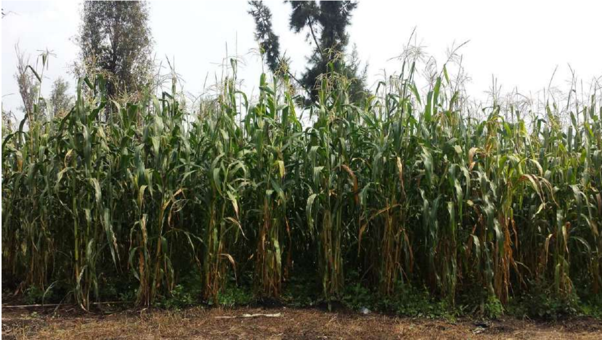
Fotografía 8 Milpa chinampera