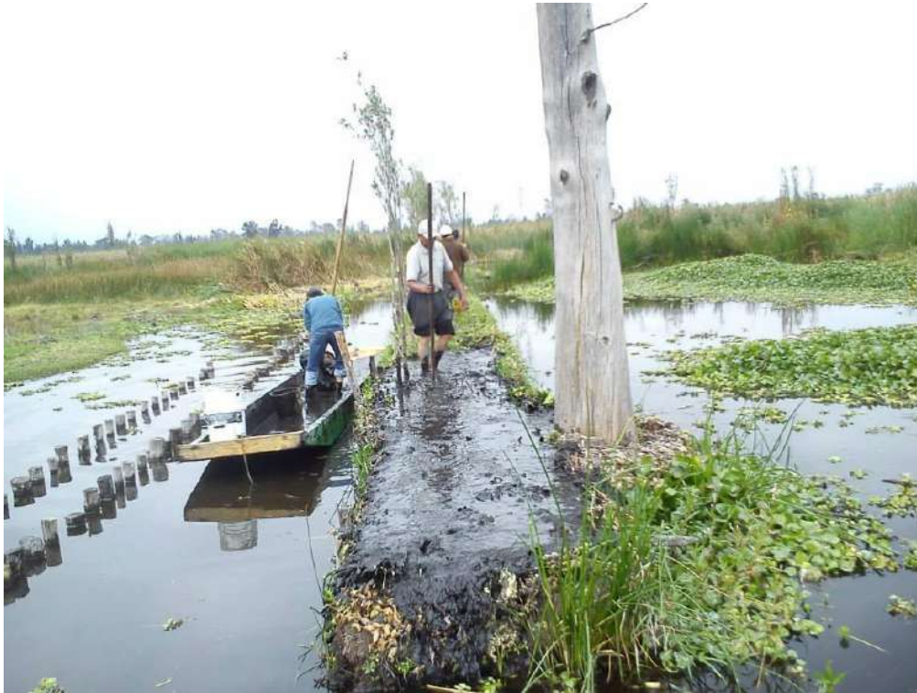
Fotografía 2 Chinamperos de Xochimilco

29.- Una de las principales problemáticas de la urbanización (entendida esta como el proceso de apropiación y transformación del medio natural con la finalidad de satisfacer las necesidades individuales de manera colectiva a través de su organización político-social); es la falta de suelo urbanizable. De acuerdo a la tradición oral de los pueblos nahuatlacas provenientes de Aztlán: los Xochimilcas fueron de los primeros pobladores en asentarse en la cuenca del Valle de México, en donde actualmente se localiza el pueblo de San Gregorio Atlapulco en la Alcaldía Xochimilco. Esta zona de tierra fértil aportaba las condiciones adecuadas para la producción agrícola, ya que la irregularidad y pendiente irregular del relieve facilitaba la absorción de agua hacia los mantos acuíferos que alimentaba los cuerpos de agua de la región.