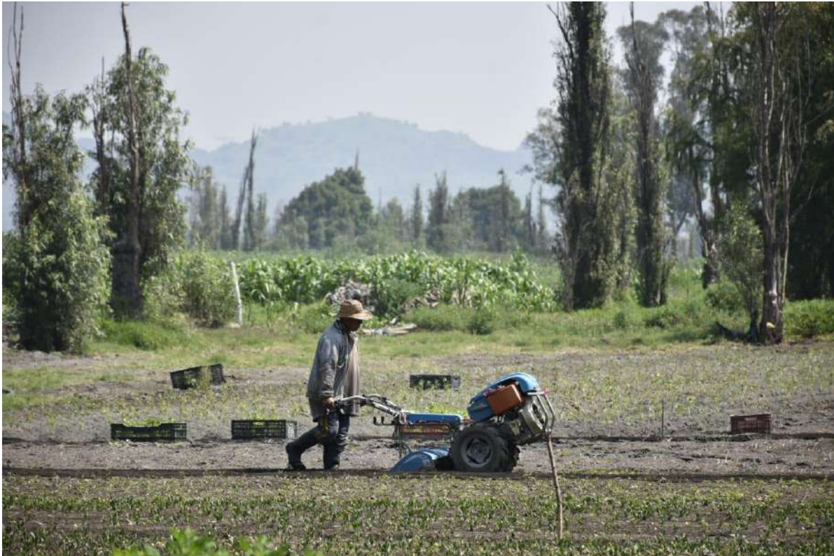
Fotografía 3 Chinampero de Tláhuac

30.- La antigüedad de la chinampa llega a casi dos mil años antes de Cristo, Las chinampas surgieron, de acuerdo con los especialistas, alrededor del año 200 aC, otros lo sitúan hacia el año 800 dC. Entre 1400 y 1600 son los años de apogeo de las chinampas en México. Es un hecho que su origen se pierde en el tiempo. "Es muy probable que el cultivo de chinampas se haya iniciado paralelamente al desarrollo de Teotihuacan como gran centro urbano durante el período Clásico, e incluso antes. Sin embargo, aún o se han localizado datos arqueológicos sobre la existencia de chinampas anteriores a la época azteca; como indicios se cuenta solamente con su posible representación en los murales de Tepantitla, en Teotihuacan, así como algunas inferencias respecto a probables obras de desecamiento de zonas pantanosas durante el formativo tardío (300-100 aC.) hechas a partir de columnas polínicas obtenidas también en el valle de Teotihuacan" (Sanders, Parsons y Stanley 1979:270). 22