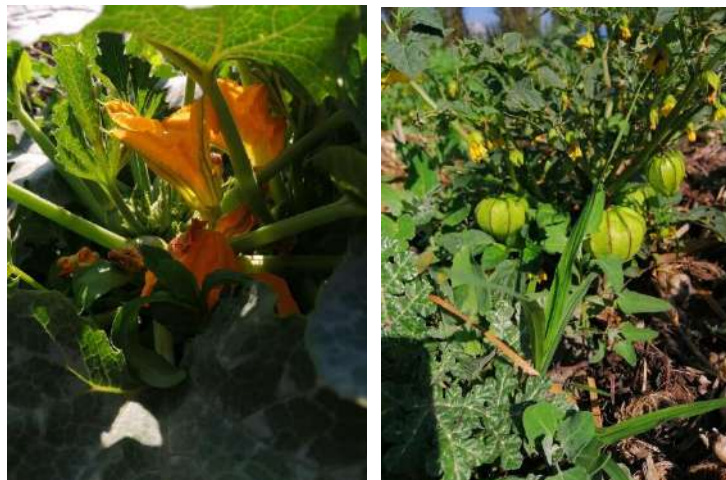
Fotografía 12 Planta de calabaza y Tomate verde

44.- La chinampa propiamente dicha es una construcción hecha a mano, artificialmente por el hombre, en áreas pantanosas o fangosas poco profundas, no necesitaba ser regada; su tamaño y al estar rodeada de agua se posibilita la filtración de agua, que mantiene un nivel de humedad adecuado. Tampoco necesita de fertilizantes, la composición de su suelo hace que esto no sea