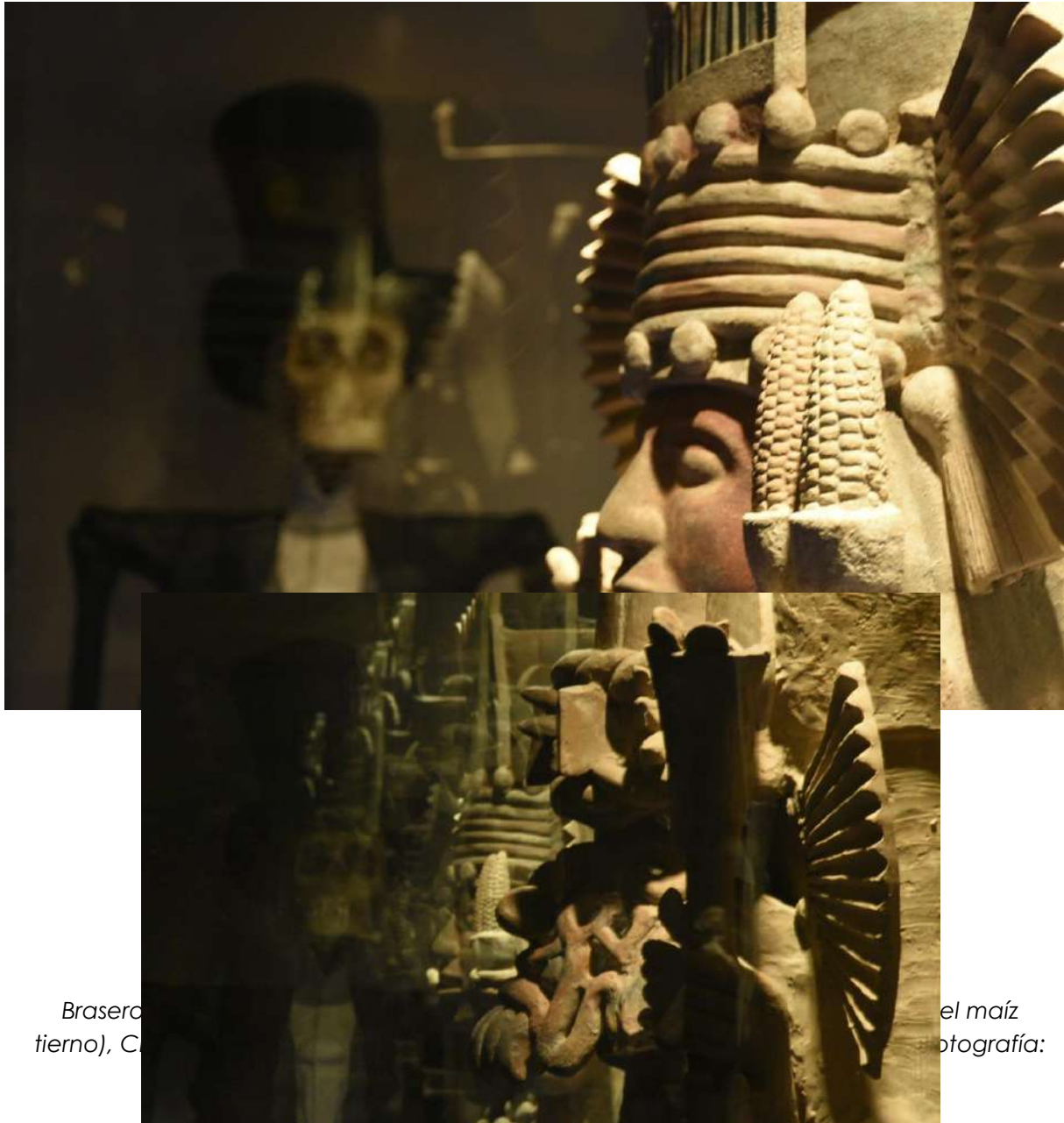
Brasero tierno), C

realizar la evaluación correspondiente para la declaratoria del "Museo Cuitláhuac: Museo Regional Comunitario de la Ciudad de México" como Patrimonio Cultural Urbano de interés para la Alcaldía Tláhuac.