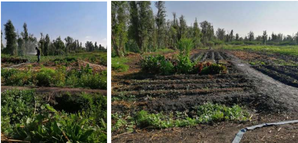
Fotografía 9 Hortaliza de chinampa en Xochimilco

41.- Tláhuac y en mayor medida Xochimilco son un testimonio vivo y activo de un ecosistema muy difundido en la antigüedad. Ambos se encuentran ubicados en lo que fue parte de una gran cuenca hidrológica en la época prehispánica, rodeada de montañas, surcada de ríos y arroyos portadores de las aguas de la lluvia y del deshielo hacia un conjunto de lagunas, con difícil drenaje. En sus orillas había zonas pantanosas con humedad permanente. Estas condiciones se repetían en varias regiones del país donde abundaba el agua y había poca pendiente del suelo. Al oriente de Tláhuac se ubican los humedales (zona de Reserva Ecológica) que pertenecen al núcleo ejidal de