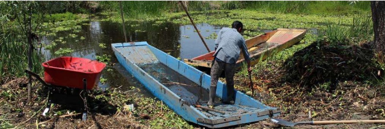
Fotografía 10 Chinampero y canoas