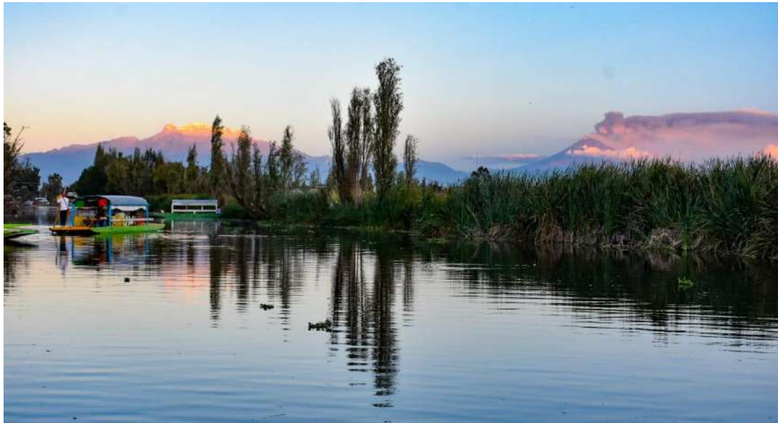
Fotografía 11 Vista del Iztacihuatl y Popocatepetl desde Tláhuac

trajineras y en ellas se cultiva la tierra, se construyen habitaciones y son habitables y autosustentables. 27