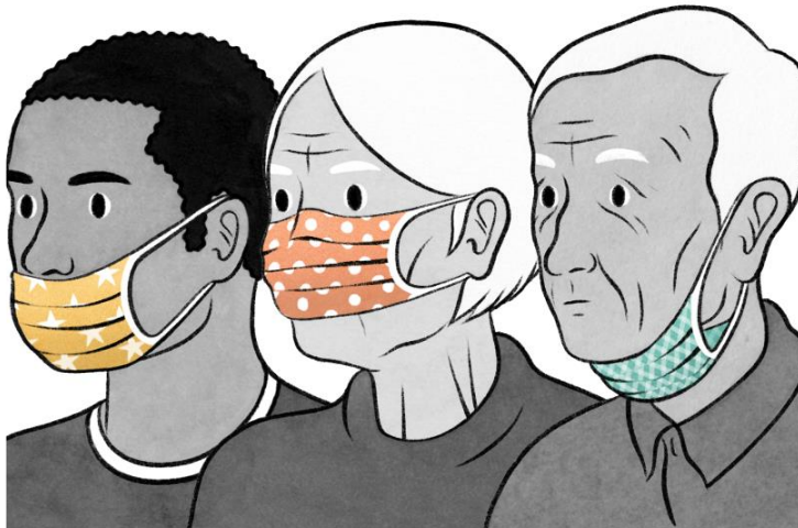
Errores comunes en el uso de cubrebocas.

fuentes (si una persona infectada la utiliza para no contagiar a otros). Sea como fuere, usar mascarilla no basta para lograr un grado suficiente de protección o control de fuentes, de modo que es preciso adoptar otras medidas personales y comunitarias para contener la transmisión de virus respiratorios. Al margen de que se usen mascarillas de forma correcta, la observancia de la higiene de las manos, el distanciamiento físico y otras medidas de prevención y control de infecciones es decisiva para prevenir la transmisión de la COVID-19 de persona a persona.