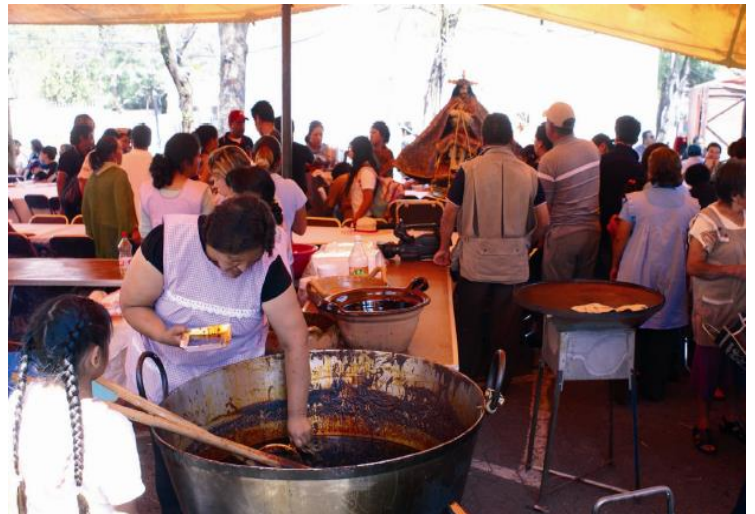
Comida preparada por las mujeres del Pueblo de Santiago Zapotitlán. 2010.