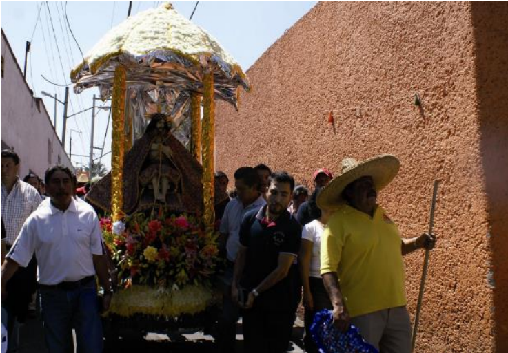
La imagen del Señor de la Misericordia, cargado por la gente de Santiago Zapotitlán. 2010.