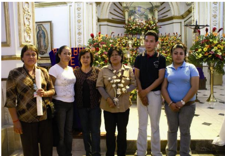
Cambio de Mayordomía. 2010.