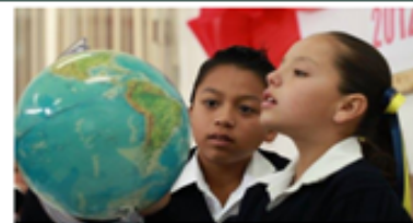
Conoce más sobre las Escuelas de Tiempo Completo

En México operan 24 mil 250 escuelas bajo esta modalidad. Para el Ciclo Escolar 2015-2016, el Programa cuenta con un presupuesto de 6 mil 819 millones de pesos, lo que representa un incremento de mil 68 respecto al ciclo anterior, en beneficio de 3.6 millones de alumnos.