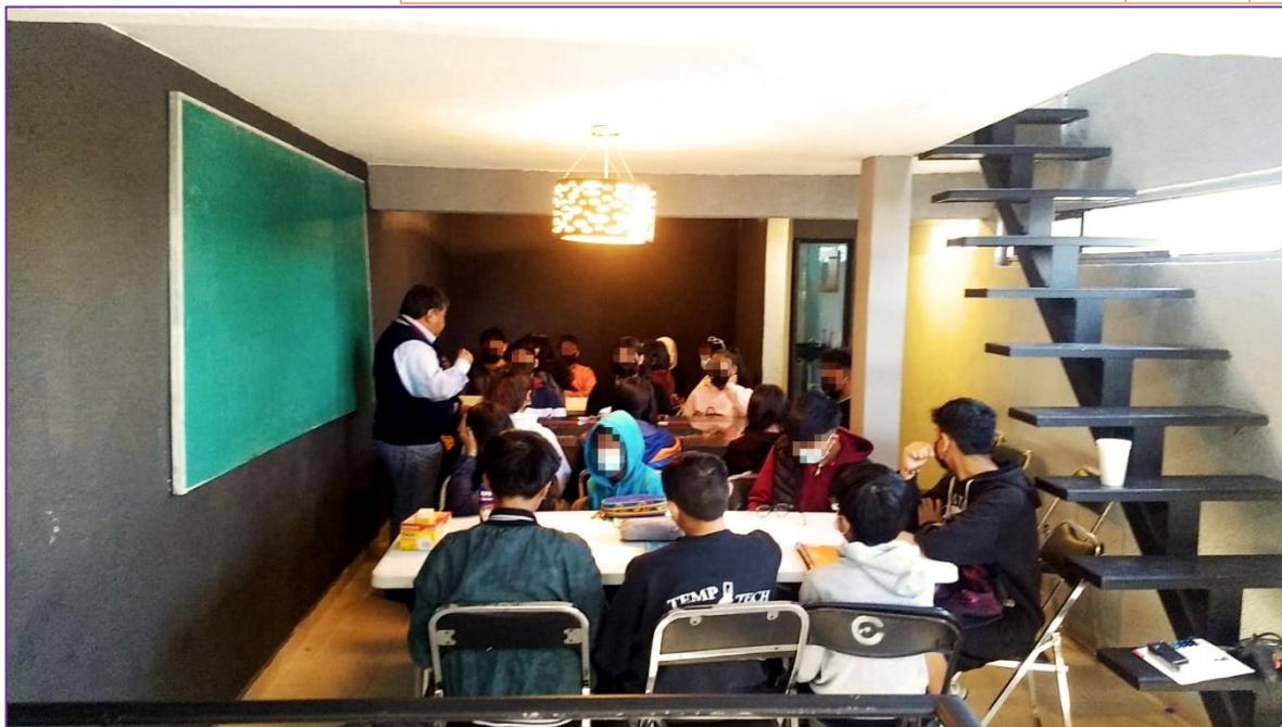
*Actividad realizada en conjunto por los diputados Xochitl Bravo Espinosa y Carlos Hernández Mirón