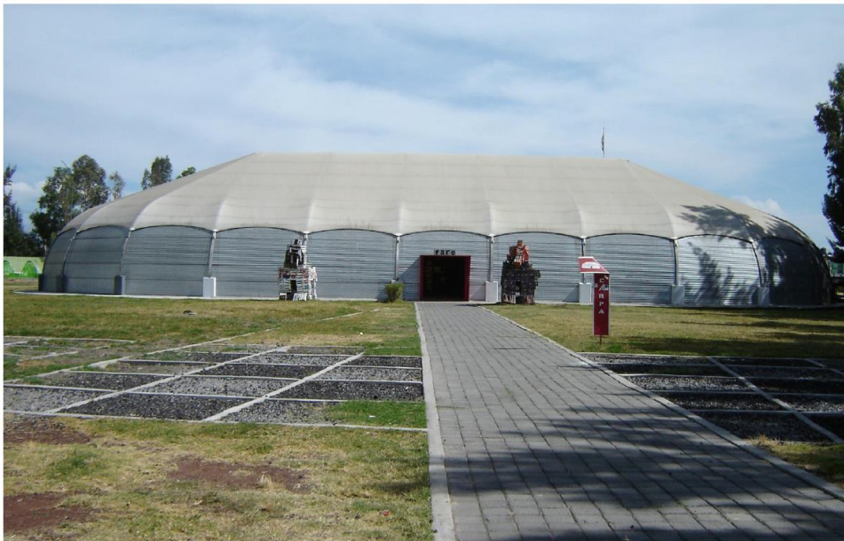
FARO de Tláhuac, 2009.