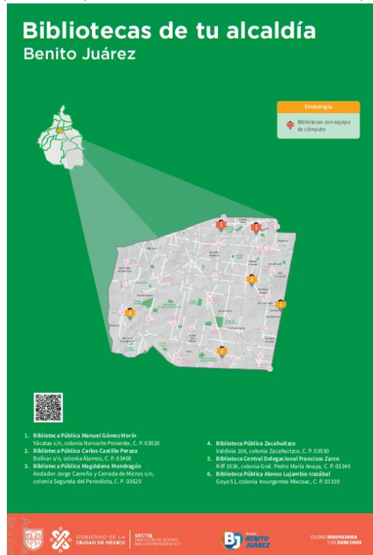
Fuente: portal de la Red de Bibliotecas de la Ciudad de México.

La importancia de difundir y promover los servicios y actividades que se desarrollan dentro de las bibliotecas públicas es fundamental para fortalecer la