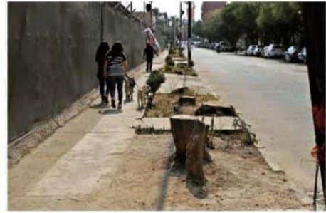
VESTIGIOS. Mientras tanto, en la colonia Irrigación, así lucen los tocones dejados por la construcción de la embajada de EU.