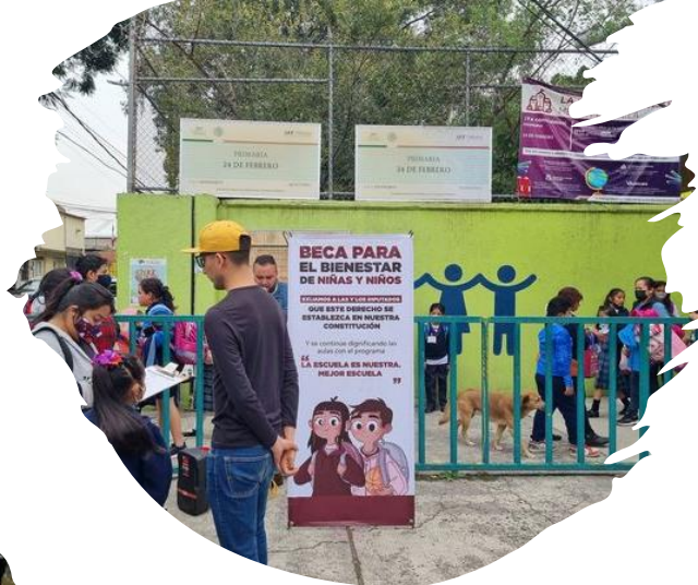
Escuela Primaria "24 de Febrero"