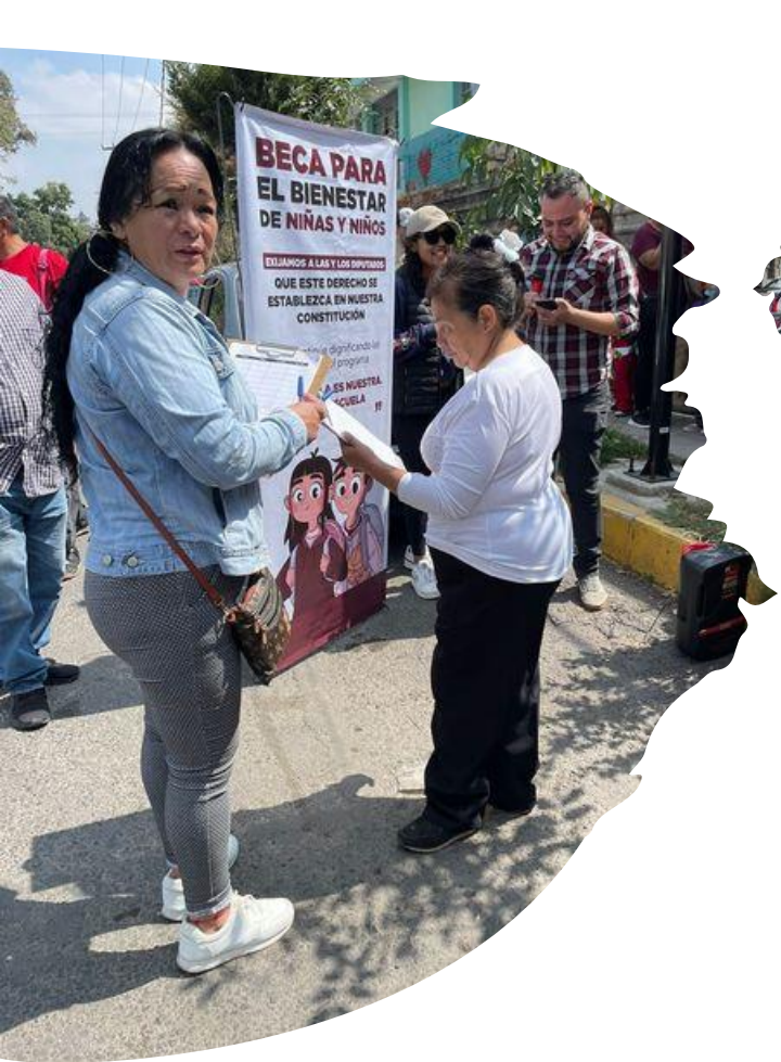
Escuela Primaria "Francisco Márquez"