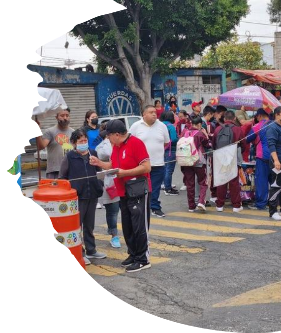
Escuela Secundaria "Vicente Suárez"

ASAMBLEAS INFORMATIVAS SOBRE LA BECA "MI BECA PARA EMPEZAR" EN LA CONSTITUCIÓN DE LA CIUDAD DE MÉXICO.