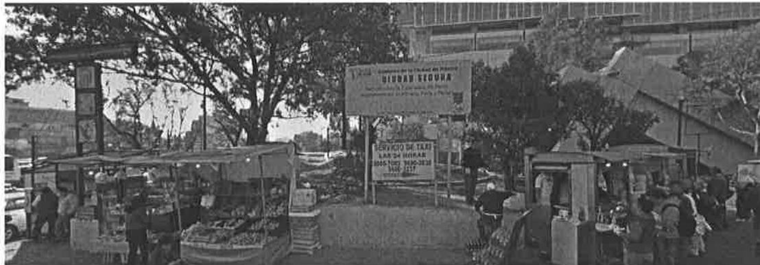
Metro Barranca del Muerto.