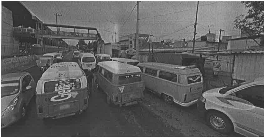
Metro Santa Martha Acátitla