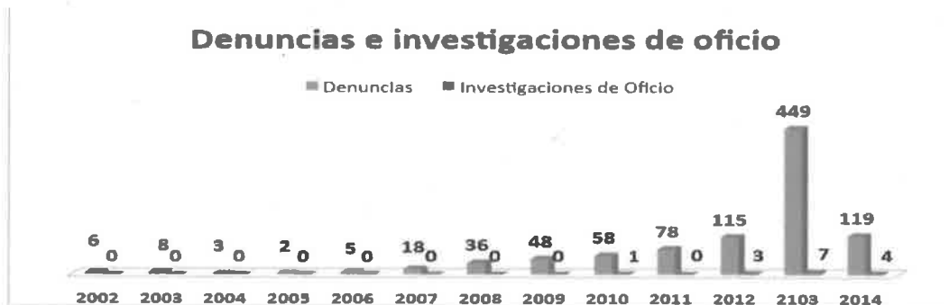
Fuente: Denuncias presentadas en PAOT, de 2002 a abril de 2014