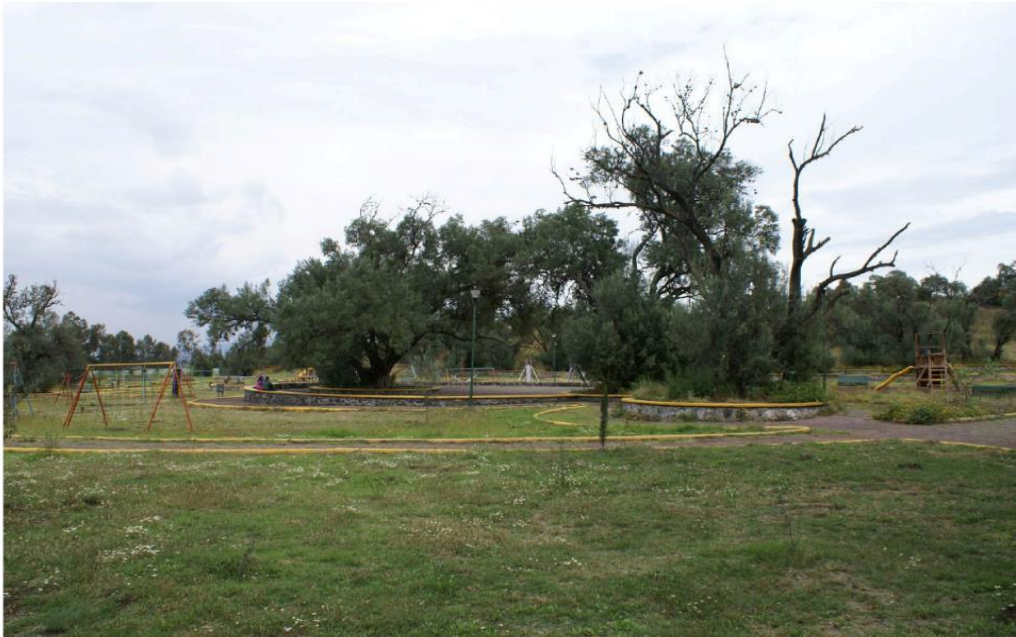
Árboles y juegos infantiles, 2009.

De la misma forma, el Parque Los Olivos es un espacio representativo del Pueblo Originario de San Juan Ixtayopan; los fines de semana se convierte en un sitio muy frecuentado por las y los vecinos, así como diferentes familias de la Alcaldía de Tláhuac.