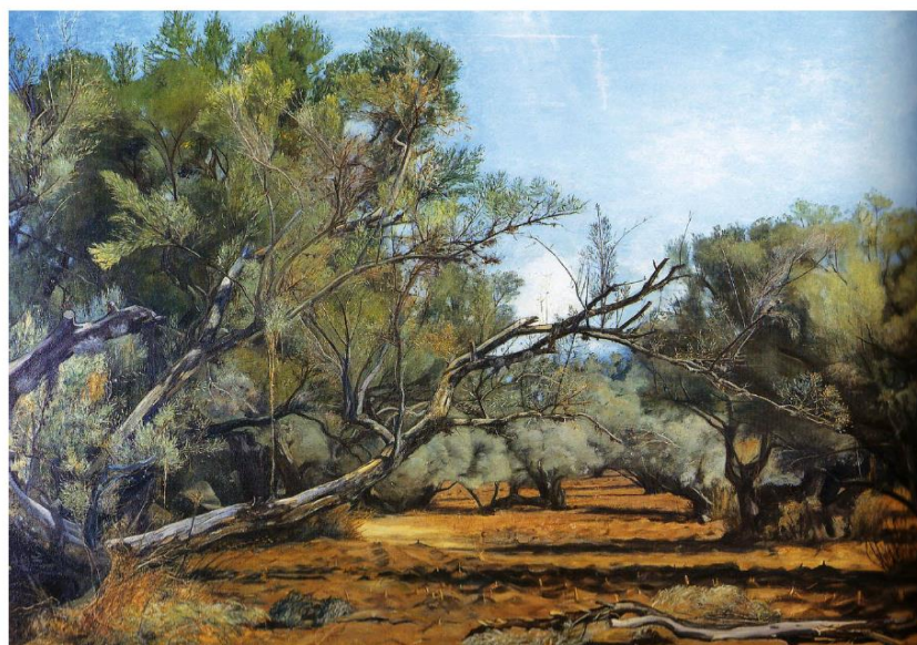
Paisaje con olivares II, s/f.