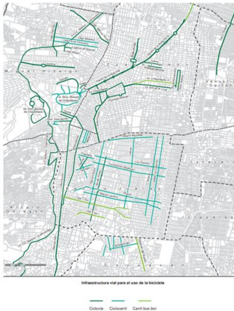
Ilustración 11: Infraestructura ciclista en la Ciudad de México, 2017