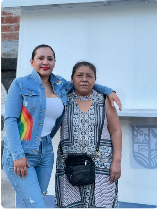
1:44 a. m. · 18 may. 2022 de Cuauhtémoc, Distrito Federal · Twitter for iPhone