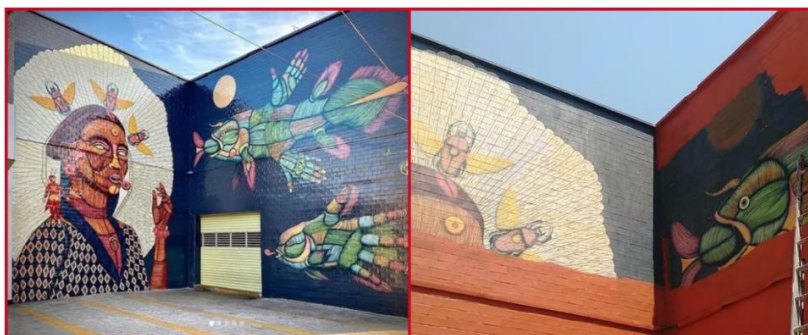
El pintor llamó a "hacer ver" a la alcaldesa Sandra Cuevas que se trata de obras artísticas. En las imágenes, el mural del mercado Juárez, en la colonia Roma, antes y después de ser tapado.

Marry Macmasters Tiempo de lectura: 3 min.