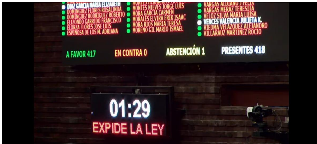
Sesión Ordinaria de la Cámara de Diputados del 6 de abril de 2021.

Cabe mencionar que lo anterior no queda únicamente como una acción propositiva; en el caso de la Cámara de Diputados dentro de su Reglamento se encuentra regulada en su artículo 60, lo cual trae consigo la garantía y continuidad en todo momento en pro de las y los ciudadanos.