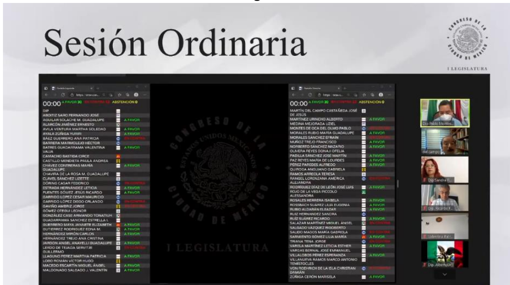
Sesión Ordinaria del Congreso de la Ciudad de México del día 8 de abril de 2021.

El Congreso de la Ciudad de México ha realizado un gran esfuerzo para coadyuvar a generar una ciudadanía informada y participativa en los asuntos públicos que en sus labores se atienden, garantizando que estos se rijan bajo los principios de transparencia, acceso a la información, parlamento abierto y máxima publicidad. En este tenor y bajo lo antes expuesto, es necesario perfeccionar los instrumentos y tecnologías que permitan a la ciudadanía que acude u observa la transmisión de las sesiones del Pleno, Comisiones y Comités, saber sobre el asunto que se está tratando en el momento.