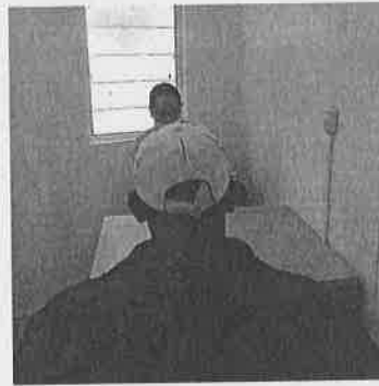
Pláticas del Grupo Arcoíris