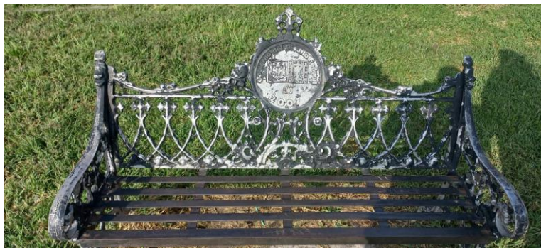
BANCAS OXIDADAS Y CON FALTA DE MANTENIMIENTO.