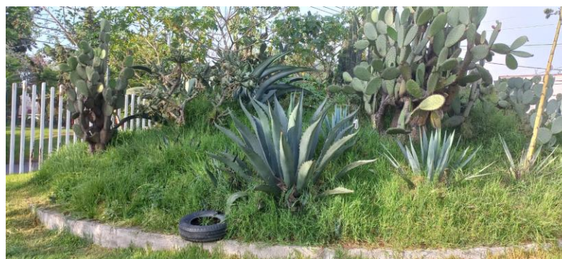
PLANTAS SIN PODA Y CON BASURA

EL LUGAR ES UTILIZADO POR DELINCUENTES PARA DROGARSE Y ESCONDERSE