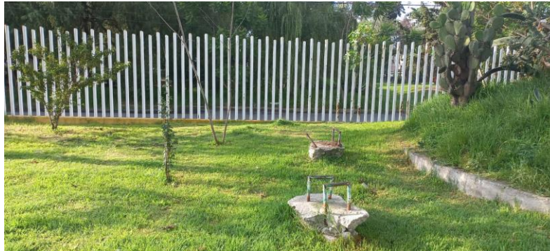
ÁREA DE EJERCICIO EN CONDICIONES DEPLORABLES.