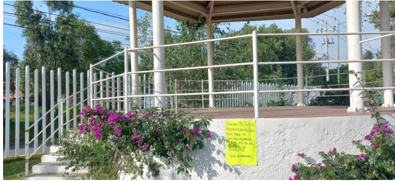
KIOSCO SIN ALUMBRADO