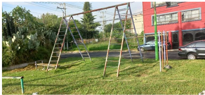
ÁREA DE JUEGOS, OXIDADOS, NO APTOS PARA USO DE LAS Y LOS NIÑOS.