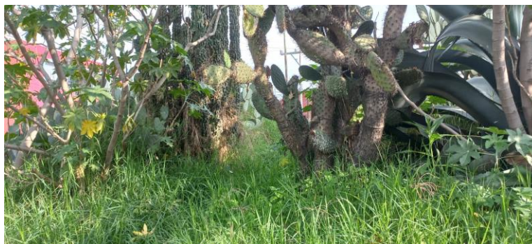
ÁREA VERDE CON FALTA DE PODA.