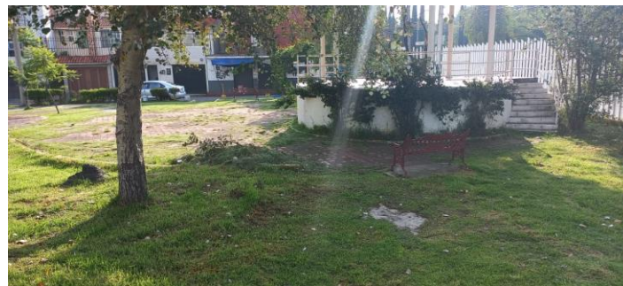
FALTA DE MANTENIMIENTO Y PODA