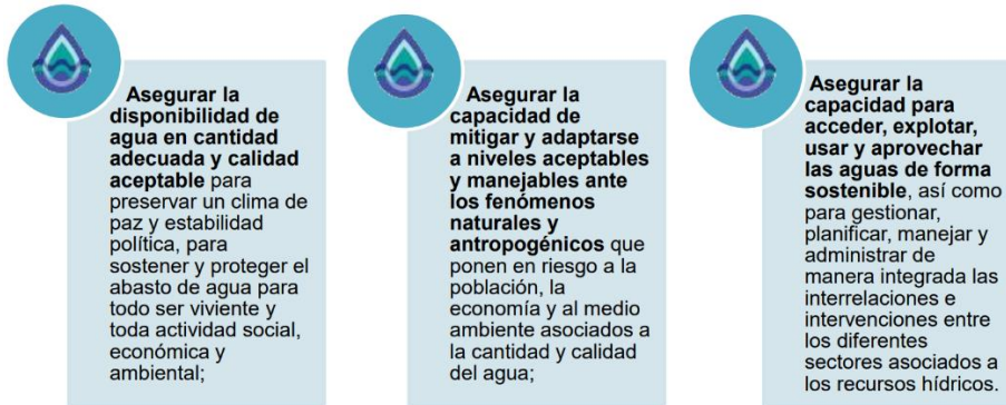
Figura 1. Realizada por el Instituto Mexicano de Tecnología del Agua.4

En consecuencia, el Estado Mexicano dispuso adoptar, de acorde a los problemas relacionados con el agua, el concepto de Seguridad Hídrica, previamente propuesto por la Comisión Económica para América Latina y el Caribe, con la finalidad de adaptarlo en un contexto nacional para: