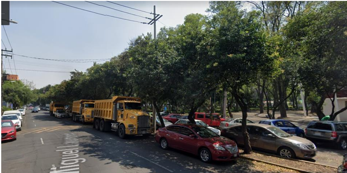
Parque de los Venados, Benito Juárez.

El uso de la vialidad para estacionamiento frente o en el entorno de espacios públicos es frecuente.