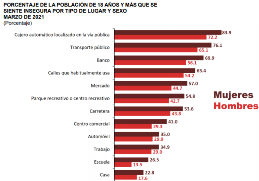
Fuente: INEGI. Encuesta Nacional de Seguridad Pública Urbana (ENSU).

El Instituto Nacional de las Mujeres ha referido que la violencia contra la mujer inhibe gravemente su capacidad para disfrutar de los derechos y las libertades en un plano de igualdad con los hombres. Las mujeres no viven la violencia de manera accidental, sino que es resultado de una discriminación arraigada y muchas veces no percibida, que el Estado tiene la obligación de abordar. La violencia en el espacio público incluye comentarios incómodos, tocamientos, violencia física, violaciones sexuales y hasta homicidios, con diversos costos y consecuencias personales y sociales. 1