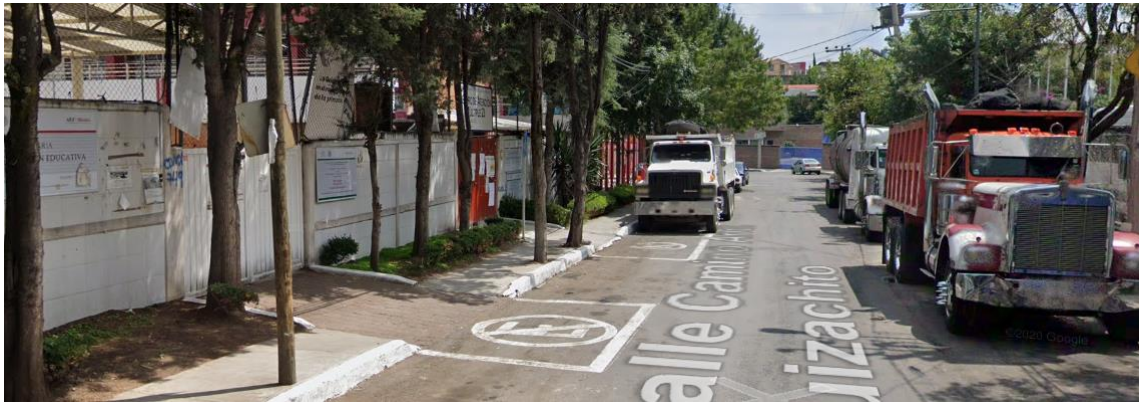
Escuela "Investigación Educativa", Cuajimalpa.

La presencia de este tipo de vehículos frente a escuelas puede ocasionar un foco de inseguridad