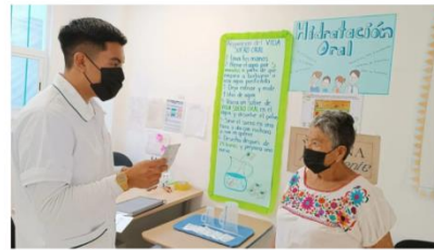
Los diputados consideraron que también es importante reiterar la difusión de recomendaciones para evitar la deshidratación extrema.

Para proteger a la ciudadanía y a los animales de compañía de posibles golpes de calor, la Comisión Permanente del Congreso local solicitó a diversas instancias del gobierno capitalino instalar puntos de hidratación en la Ciudad de México.