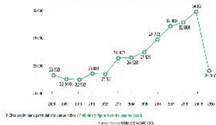
Ocupación en la industria cinematográfica (puestos de trabajo totales) en 2008-2020

Ahora bien, una de las industrias más afectadas por la pandemia por el COVID-19, en México y en el mundo, fue la industria del cine. En nuestro país, durante el año 2020 se perdieron más de 10 mil puestos de trabajo ocupados en la industria cinematográfica en México respecto a las cifras del 2019, pasando de 34,831 a 24,146.