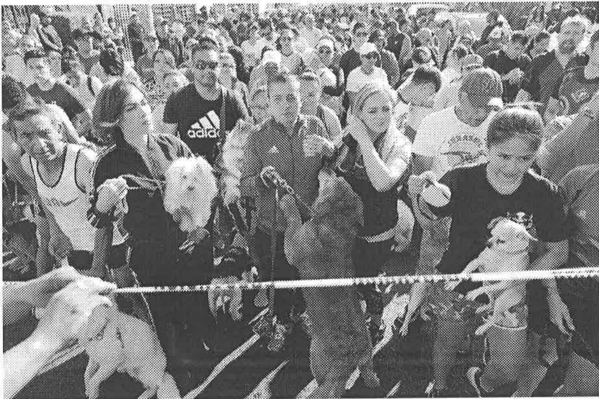
Con la participación de más de 700 mascotas, la Alcaldía Coyoacán llevó a cabo el Primer Maratón Canino 2023, en la unidad Villa Panamericana.

Laura Gómez Flores | Tiempo de lectura: 2 min.