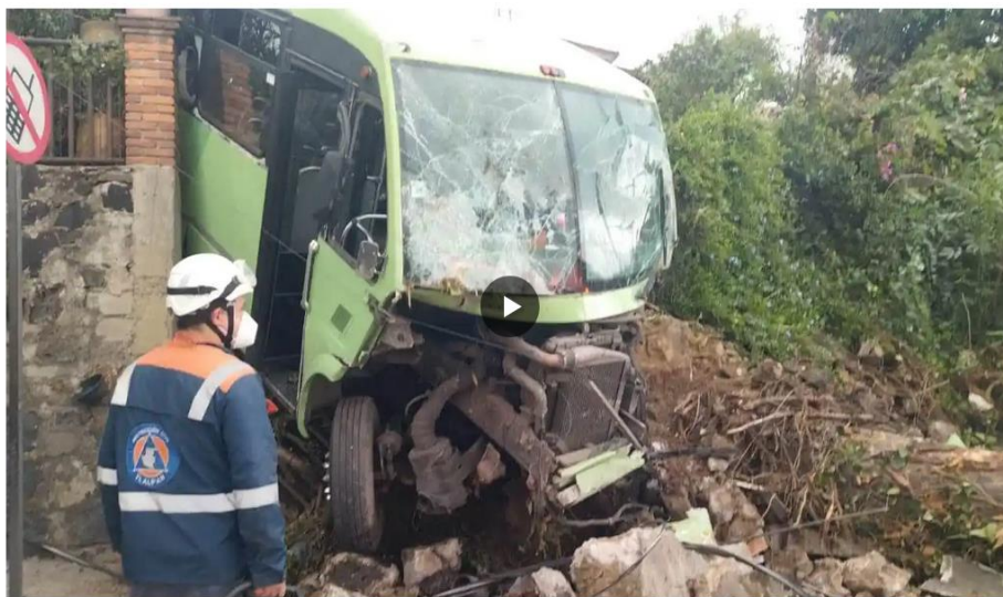
El tránsito se encuentra complicado, debido a que fue cerrada la circulación en ambos sentidos:

Los primeros reportes señalan que el transporte público transitaba por una cuneta cuando perdió el control debido al exceso de velocidad