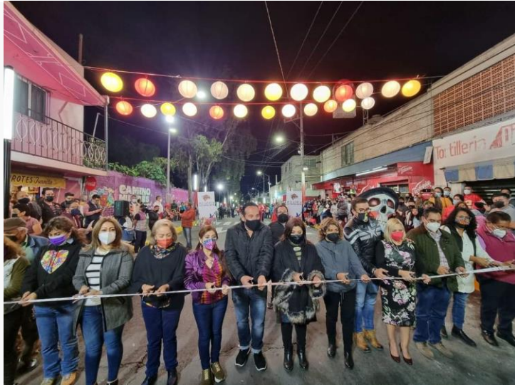
INAUGURACIÓN DEL CAMINO "MUJERES LIBRES Y SEGURAS" EN LAS CALLES BENITO JUÁREZ Y CUAUHTÉMOC, IZTAPALAPA.