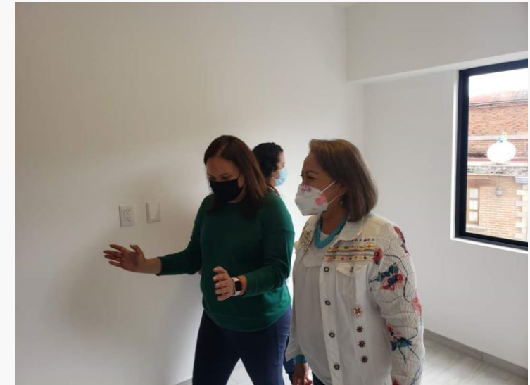
ENTREGA DEL EDIFICIO DE PACÍFICO 223 EN COYOACÁN