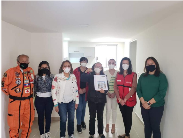
ENTREGA DEL EDIFICIO ESCOCIA 29 EN COYOACÁN.