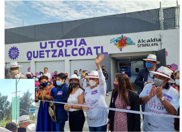
INAUGURACIÓN DE LAS UTOPIÁS OLINI, SANTA CRUZ MEYEHUALCO Y QUETZALCÓATL.