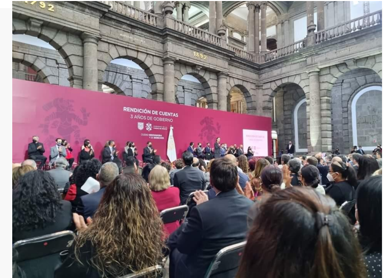
RENDICIÓN DEL 3ER INFORME DE GOBIERNO DE LA JEFA DE GOBIERNO, CLAUDIA SHEINBAUM.