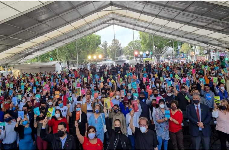
ENTREGA DE 5 MIL LIBROS GRATUITOS COMO PARTE DEL PROGRAMA "21 PARA EL 21".