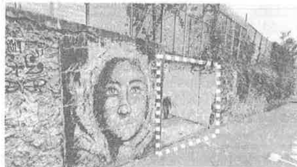
Acceso puente peatonal subterráneo por calle Temax

Considerando lo antes expuesto y en el marco de nuestras atribuciones, esta Secretaría se encuentra en la mejor disposición de coadyuvar con la demarcación territorial y las dependencias locales con injerencia en la materia.